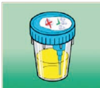
Рисунок 2. Защитная наклейка на стаканчике для пробы