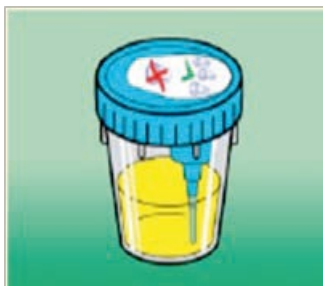
Рисунок 2. Защитная наклейка на стаканчике для пробы