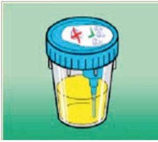
Joonis 2. Proovitopsi kaitsekleebis