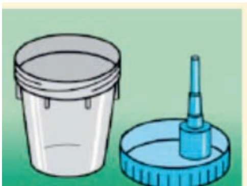
Joonis 1. Proovitops ja kaas