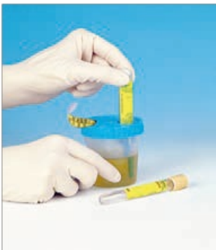
Joonis 4. Vaakumkatsuti täitmine

Suruge proovitopsi kaanes oleva avause kaudu vaakumkatsuti, kork ees proovitopsi põhja (joonis 4). Vaakumkatsuti täitub uriiniga. Hoidke katsutit, kuni uriinivool lakkab.